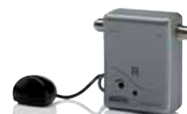
Extra IR Receiver To operate the A/V devices connected from several rooms EU version Art.nr. 09709 / UK version Art.nr. 09715